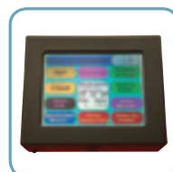
Controllo Touch Screen

autoregolare l'intensità ed il tipo di massaggio