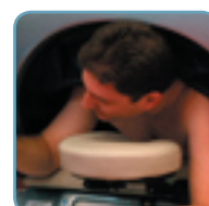
Avanzato controllo manuale