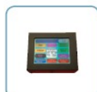
Controllo Touch Screen

effettuare un massaggio in piena privacy ed al caldo autoregolare l'intensità ed il tipo di massaggio